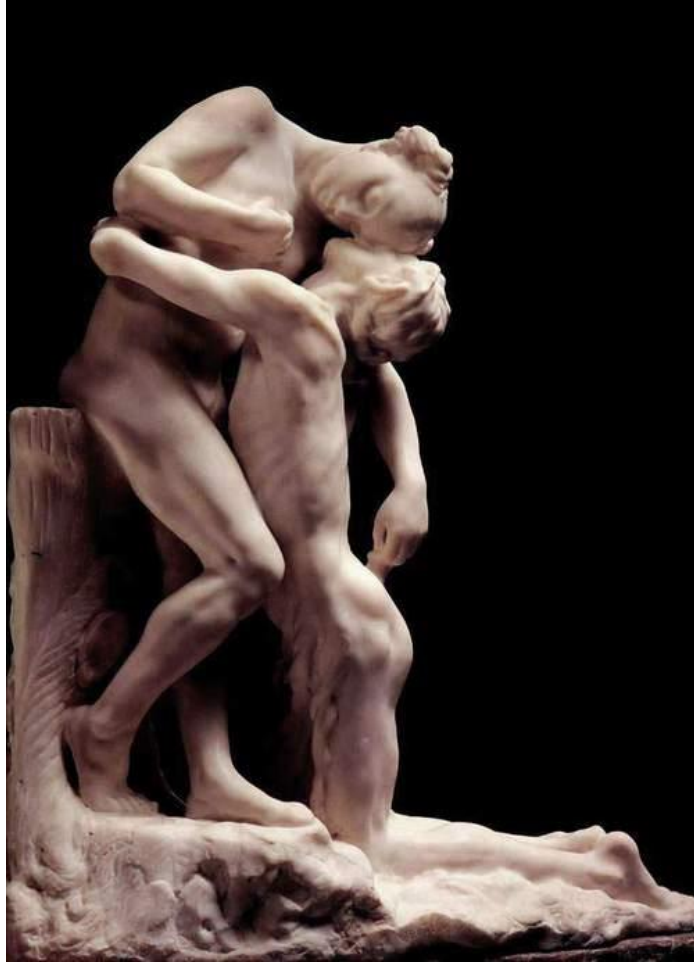
Görsel:2 Camille Claudel, Sakuntala,1903. Fransa Claduel Müzesi.( URL:1 )