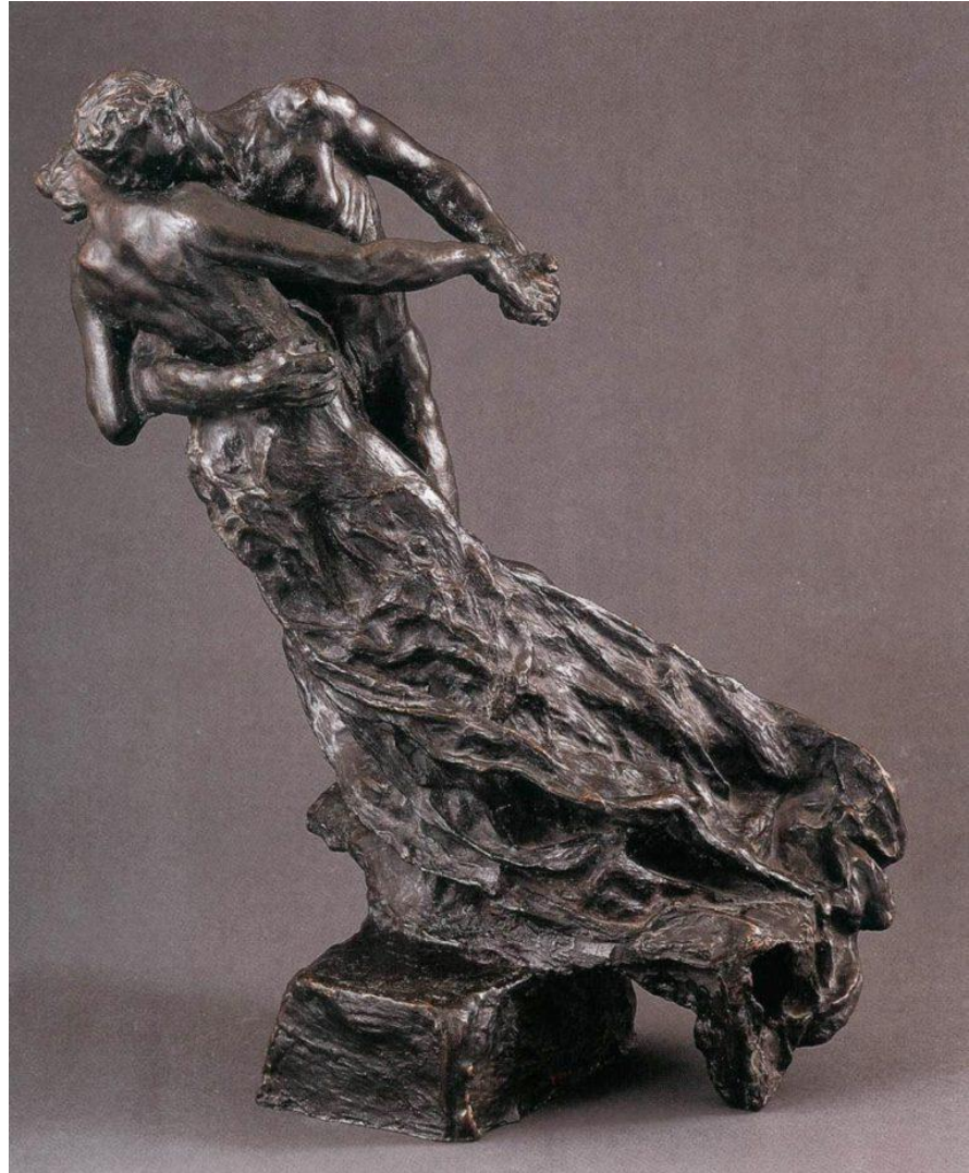
Görsel:1 Camille Claudel, Waltz,1889-1905. Fransa Claduel Müzesi.(URL:1)

Bireysel bir sanatçı olarak kendini kanıtlamıř olsa da, insanlar onu her zaman Rodin ile karřılařtırmıř yeteneđini ve tekniđini ünlü heykeltırařın himayesine bađlamıřlardır. Kendisini eski ortađından daha fazla ayırt etmenin ve kendi yaratıcılıđını ve dehasını ortaya koyarak bir yol arayan Claudel, alıřmalarıyla yeni bir yön almıřtır. Daha cesur kompozisyonlar, yeni konular ve daha zor malzemelerle daha samimi sahneleri keřfetmeye bařlamıřtır. The Waltz, The Waveve, Sakuntala gibi paralar da dahil olmak üzere sansasyonel alıřmalarından bazıları bu döneme aittir.