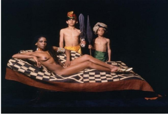
Görsel 2. Renee Cox, 200, Olympia'nın Oğlanları/ Olympia's Boys Tate./Erişim :18.04.2022. http://www.artnet.com/artists/Renee_Cox_