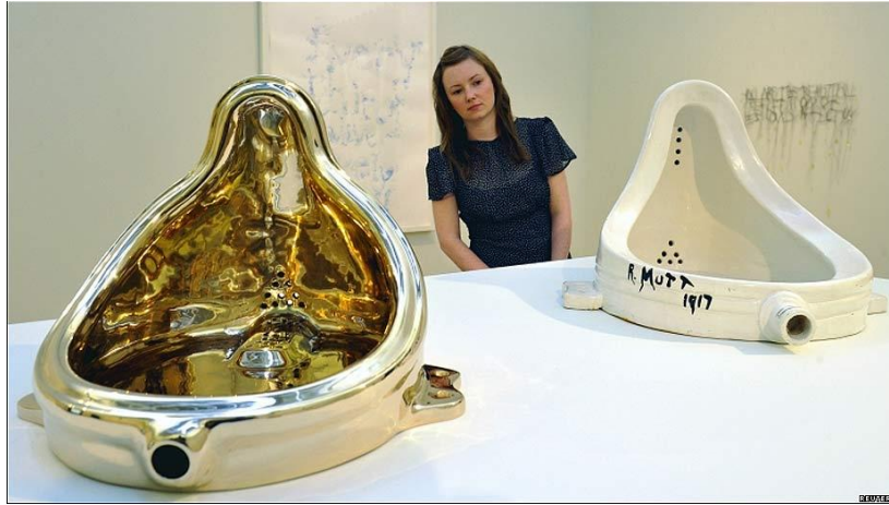
Görsel 4. Sherrie Levine, 1991,Çeşme/ Fountain. Tate./Erişim :18.04.2022. http://www.fakultesanat.com

Sherrie Levine'in fotoğraf tarihinin erkek üstatlarına atfedip kendine mal ettiği fotoğraflarda erkekler tarafından çekilen fotoğrafları ya da üretilen yapıtları tekrar oluşturup fotoğraflayan Levine, kadın duyarlılığına ve kültürün dayattığı imajlara dikkat çekmektedir. "Walker Evanstan Sonra (After Walker Evans 1981)" , " Marcel Duchamptan Sonra (Fountain After Marcel Duchamp 1991)" (Görsel 4.) isimler verdiği çalışmalarında sanatçının ve sanat eserinin biricikliğinin ölümüne dikkat çekerken nesnel gerçekliklerinden kopardığı görüntülere yeni anlamlar kazandırarak başkalaştırdığı ifade edilmektedir.