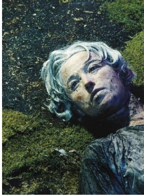
Görsel 1. Cindy Sherman, 1985, İsimsiz:153 /Untitled :153.

Sherman, Renee Cox, Sherrie Levine, gibi sanatçıların birbirinden farklı, biçimini bozmadan ona bambaşka bir içerik vererek oluşturdukları parodik yapıtlarını aynı zeminde buluşturmuş olmalarıdır. Örneğin; Cindy Sherman Batı sanatının portre geleneğini kendi vücudu üzerinde yeniden yapılandırır. Sherman erkeklerin gözünden kadınları yansıttığı çalışmalarından “İsimsiz: 153”( Görsel.1 ) de kadınların tarih boyunca şiddete maruz kalmalarına, tecavüz edilip öldürülmelerine tepki olarak kendisini öldürülmüş bir kadın imgesine dönüştürmüştür. (Şahmaran,2018,s.267)