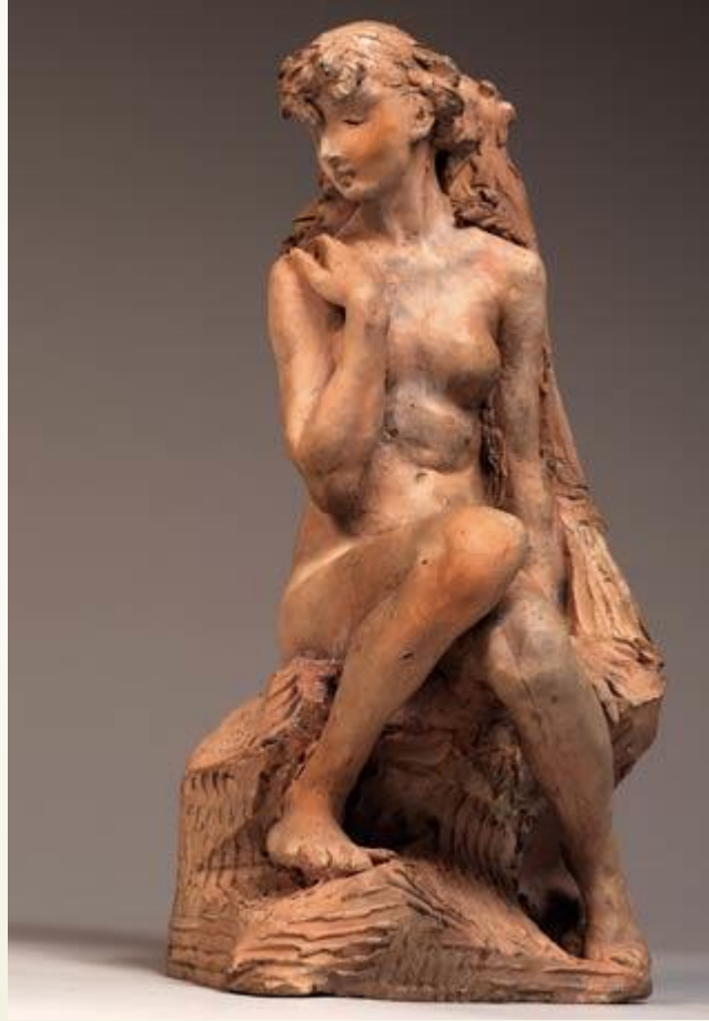
Görsel:10 Claudel,Genç Kız,1903 Fransa Claduel Müzesi (URL:1)

Erken dönem sanatında yaptığı ilk heykellerden biri olarak karşımıza çıkan ‘Genç Kız’ eserinde ahşabı materyal olarak kullanan sanatçı ilerleyen sanatında şekillendirilmesi zor ve oldukça sert materyalleri kullanmayı tercih etmiştir. (Altıntaşlı 2017).