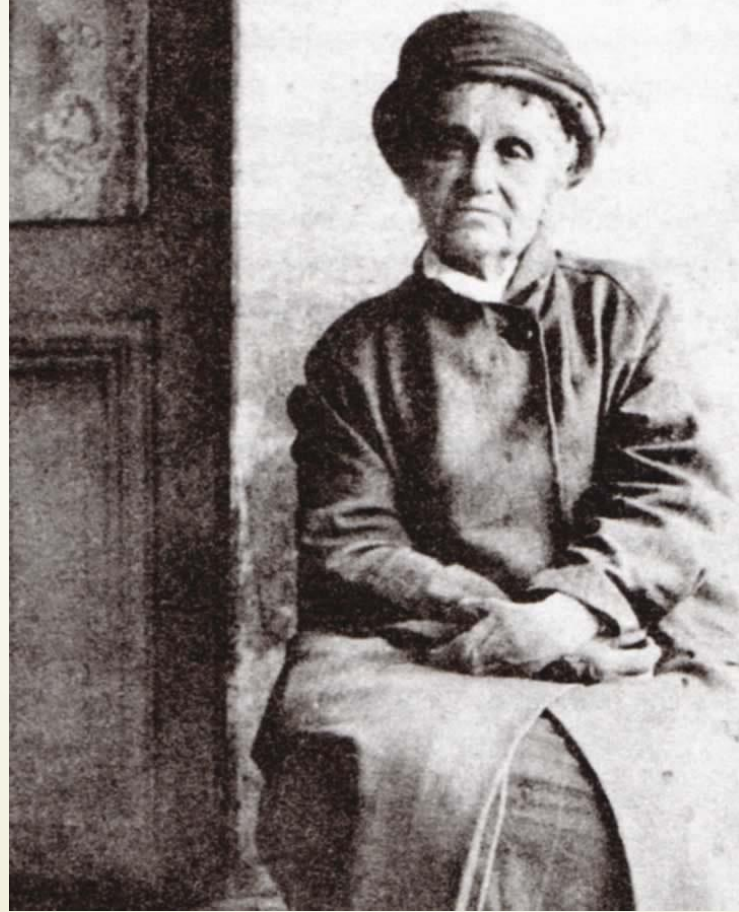
Görsel 14:Camille Claudel Akıl Hastanesinde (URL 1)