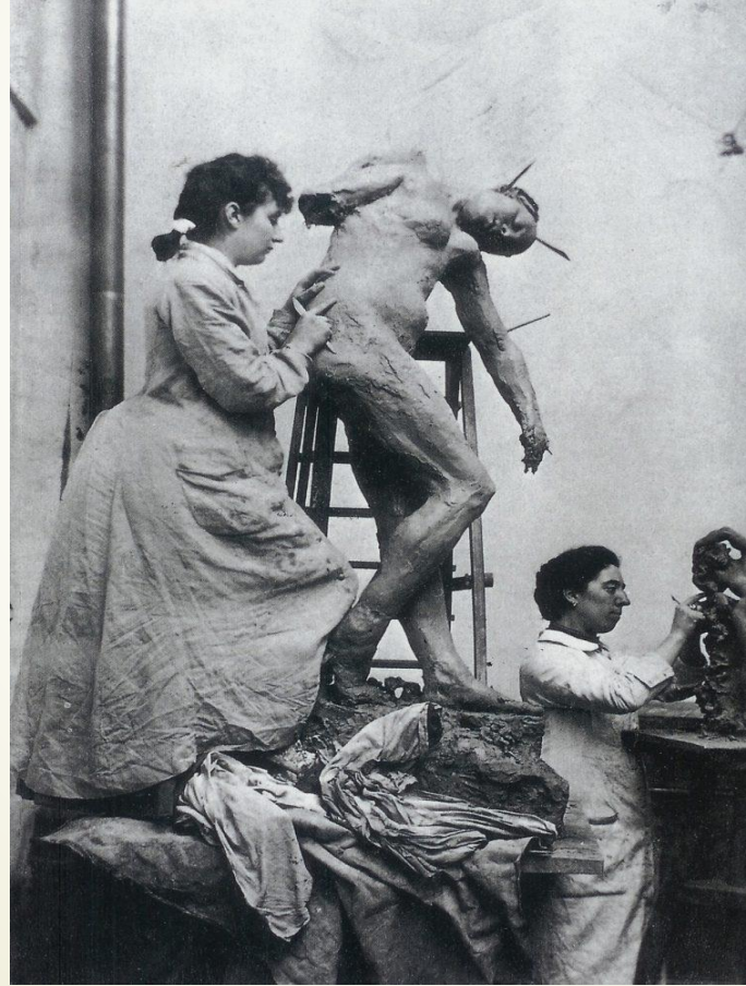
Görsel:3 Claudel atölyede çalışırken ( URL:1)

1881'de Louis-Prosper Claudel, oğulları Paul Claudel'in yüksek öğrenime devam edebilmesi için eşini ve üç çocuğu ile Paris'e taşınmıştır. Daha sonra 17 yaşında, Camille bu fırsatı sanatsal eğitimine devam etmek için kullanmış ve Académie Colarossi'ye kaydolmuştur. Son derece ilerici bir sanat akademisi, Académie Colarossi sadece kadınların orada okumasını kabul etmekle kalmamış, aynı zamanda çıplak erkek modellerden çalışmalarına izin verilmiştir (Altıntaşlı 2017) .