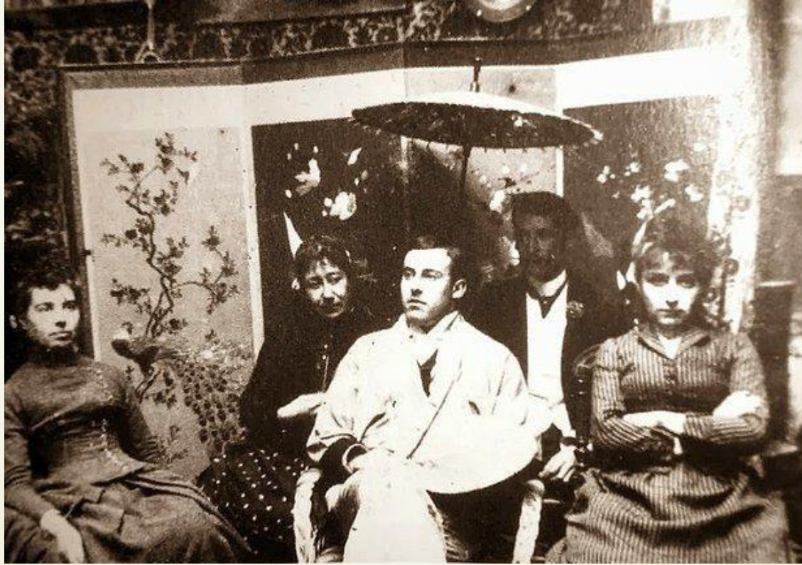
Grsel:5 Rodin ve Claduel ( URL:1)

Rodin, Claudel'in alıřmalarından hemen etkilenmiřtir. 'Old Helen' gibi ilk alıřmalarında grnen cesur gerekilik onu etkilemiř ve kısa sre sonra onu kendi stdyosunda ırac olarak birlikte alıřmaya davet etmiřtir. Claudel, 1883 civarında Rodin'in stdyosuna resmen katılmıřtır (Altıntařlı 2017).