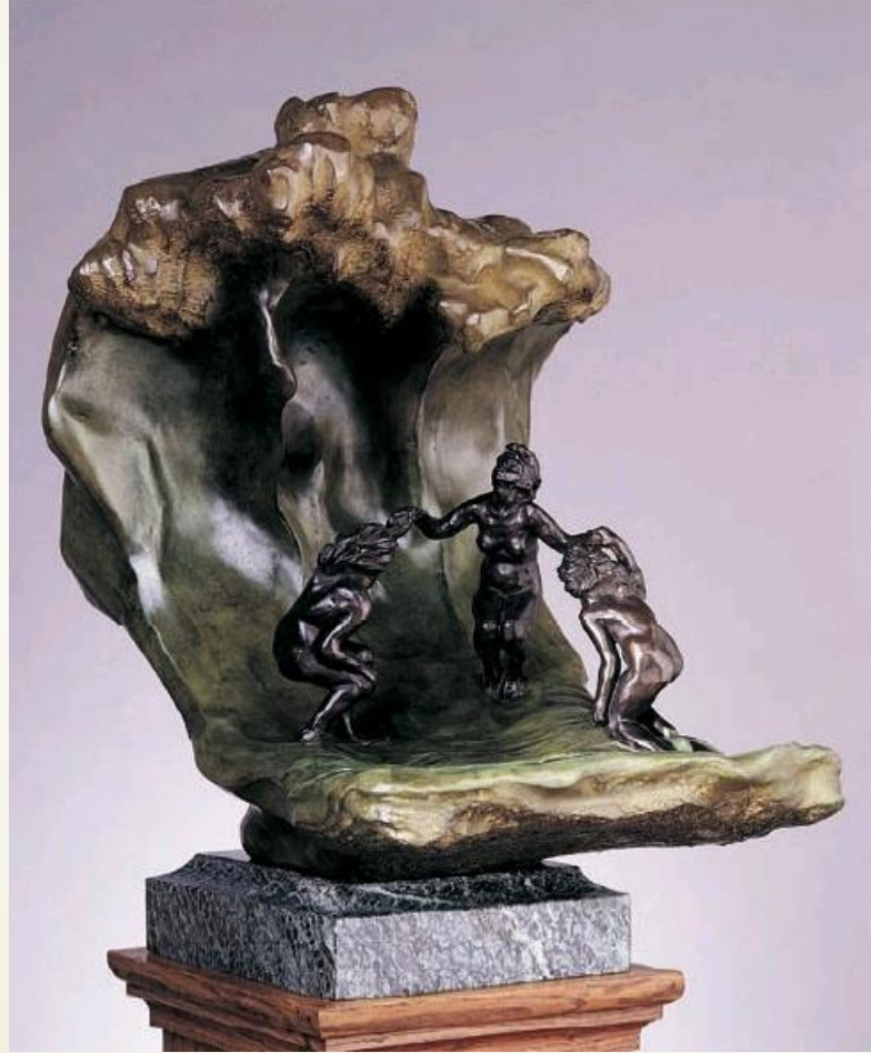
Görsel:12 Camille Claudel, Dalga, Fransa Claduel Müzesi 1903 (URL:1)