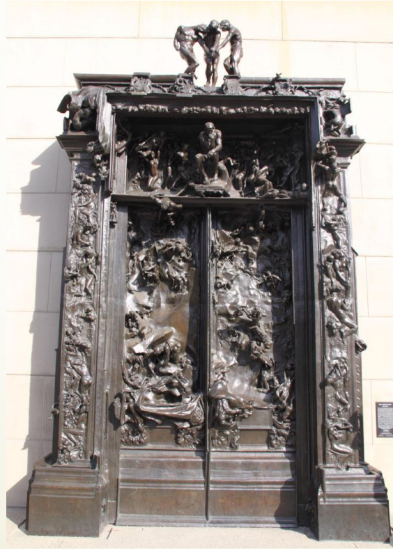
Görsel:6 Augusto Rodin, Cehennem Kapıları.1917. Paris Rodin Müzesi. (URL.1)

Claudelo bu atölyede becerilerini geliştirmiştir. Rodin'den öğrendiği bilgiler doğrultusunda Rodin'in çalışmalarından 'CehennemİN Kapıları' ve 'Calais'in Burghers' gibi en tanınmış eserlerine eşit parçalarda katkıda sağlamıştır. Ancak Rodin ile çalıştığı süre boyunca Claudel, bağımsız bir sanatçı olarak kendini savunmak için adımlar atmıştır. 1882 ve 1889 yılları arasında Salon des Arts Français düzenli olarak sergi açtı ve Rodin aracılığıyla yapılan bazı bağlantılar sayesinde Claudel bazı parçalarını 1890'larda Fransız Müzeleri tarafından satın alınmıştır (Altıntaşlı 2017).