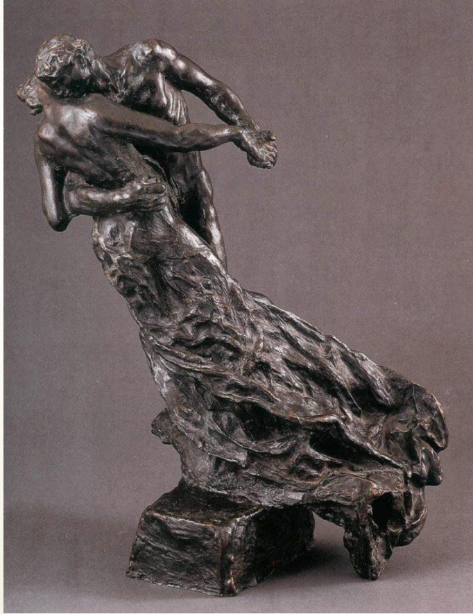
Görsel:9 Camille Claudel, Waltz, 1889-1905, Fransa Claduel Müzesi (URL:1)