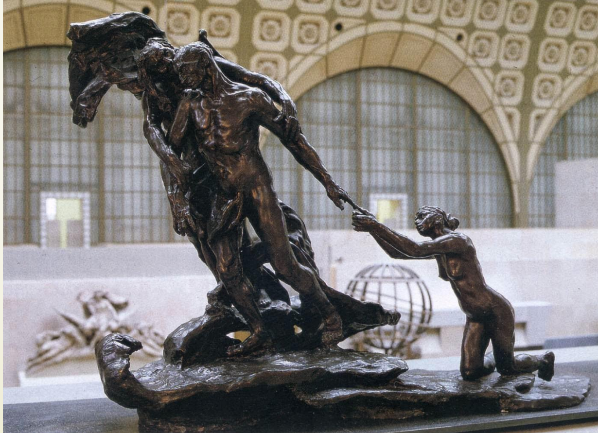
Görsel 13: Camille Claudel, Kader, 1913 Fransa Claduel Müzesi