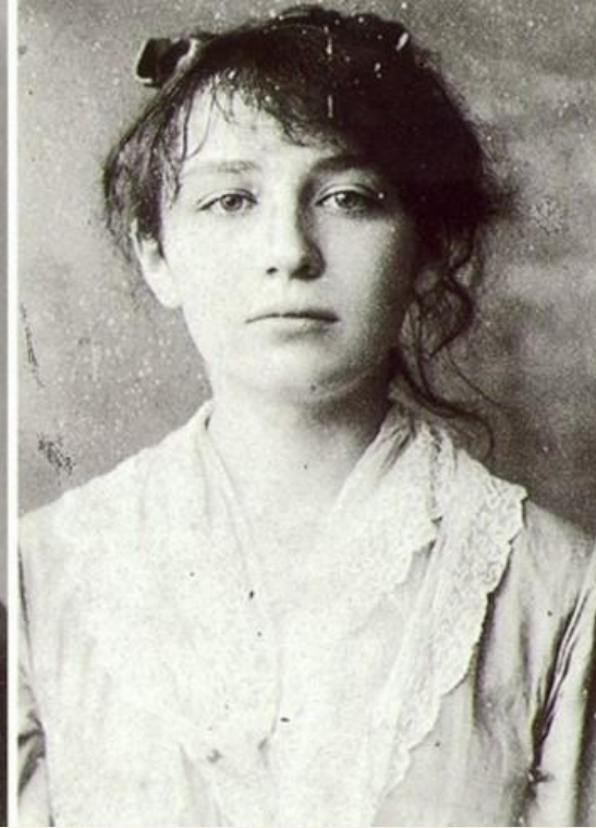
b) Camille Claudel ( URL:1)